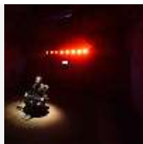
© Zentrum für Internationale Lichtkunst Unna

http://www.leitmarktagentur.nrw/leitmarkt Wettbewerbe/ikt/runde2